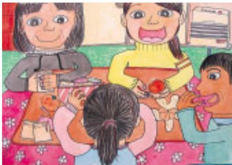
「みんなでおしゃべり 楽しい ひととき」 友部町立友部小6年 杉森 みなみ